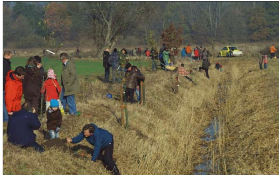
Im Jahre 2011 haben viele Baumpaten an der Pflanzaktion an der Mittelriede nördlich der B1 teilgenommen. Der Verein ProWabe hat diese Aktion initiiert und die Bäume für die Pflanzungen beschafft.