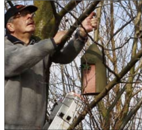
So ähnlich sehen die angebotenen Nisthilfen aus.

Dieses Foto zeigt die Auswahl der zur Verfügung stehenden Nistkästen. Der Durchmesser der Löcher beträgt je nach Modell 32-34 mm, Nistkästen, die mit einem Spezialnagel aus Aluminium an einen Baumstamm genagelt werden, sind mit einem Marderschutz ausgestattet, um diesen Räubern den Zugang zum Innenraum des Kastens unmöglich zu machen. Frei an Ästen aufgehängte Kästen benötigen diesen Schutz nicht.