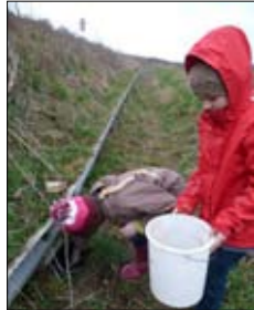
Krötensammler in Aktion

Seit 2011 hat ProWabe an der B1 nahe des Schöppenstedter Turmes im Frühjahr Amphibienschutz betrieben. Mit Unterstützung der Bingo-Umweltstiftung und mit städtischen Mitteln wurden dann 2013 am Fuße des Straßengrabens der B1 etwa 300 m